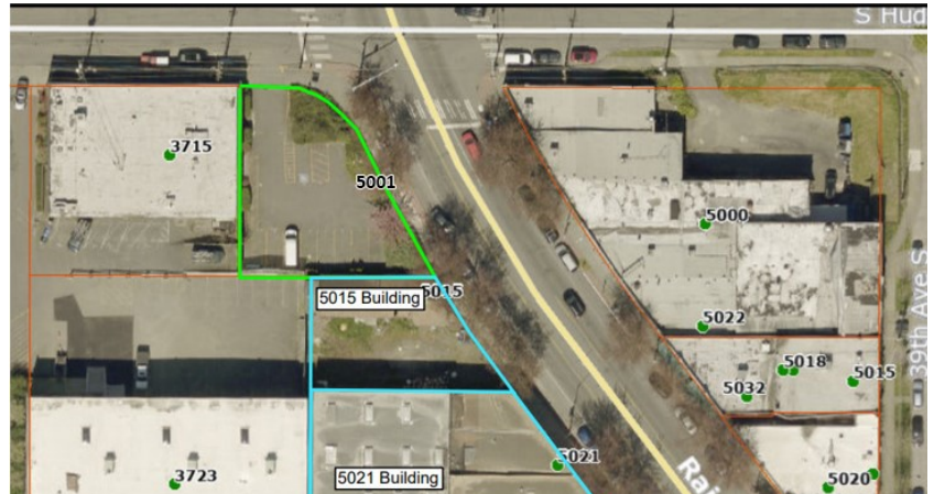
清理场地的鸟瞰图