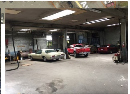
前汽车修理厂 Rainier 大街南 5021 号

由于该地块的历史用途，有必要在该地块制定 PPCD。该场地的北部（Rainier 大街南 5001 号）、中部（Rainier 大街南 5015 号）和南部地块（Rainier 大街南 5021 号）有着不同的历史。从 1927 年到 1970 年代初，北地块至少被用作两代加油站。中部地块约在 1926 年至 1965 年间被用作木材场办公室，1966 年至 1980 年间被用作保险代理人办公室，1980 年至今被用作便利店。南部地块在不同时期曾被汽车维修保养厂、汽车和船舶经销店、管道供应公司、台球厅、健身中心和书店（当前的租户）使用。先前在该场地进行的经营导致土壤和地下水受到石油和氯化溶剂污染，将在补救调查中确定污染程度。