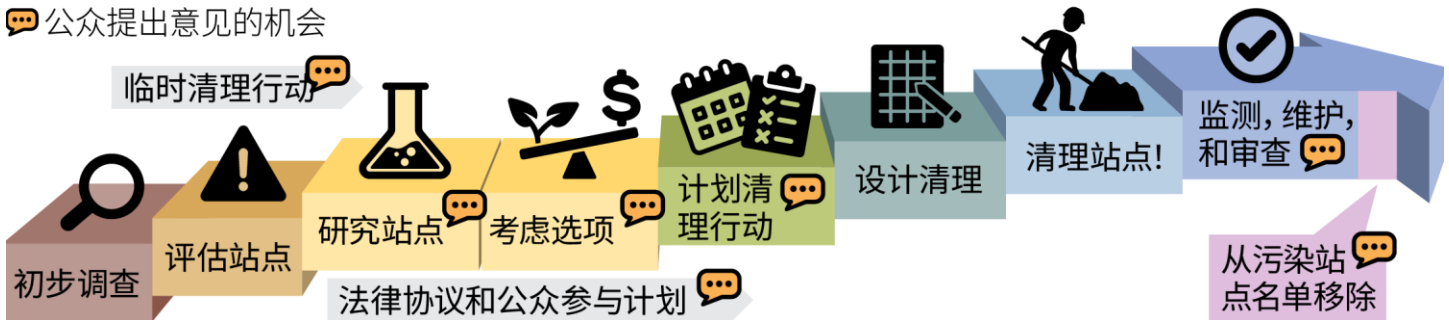
华盛顿 (Washington) 州正式清理程序