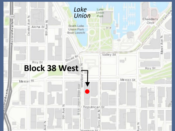
Block 38 West清理工作站位置

www.go.ecology.wa.gov/Block38WestComments