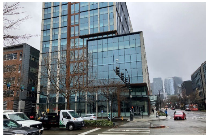
2023年2月Block 38 West地产上的新建建筑