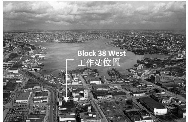
1949年South Lake Union的航拍图像。

2019年10月下旬在Block 38 West地产开始重建。原有建筑拆除，取而代之的是一栋多层混合用途建筑，12层临街上，4层地下停车场。新建筑的施工需要对整个Block 38 West地块进行大规模挖掘，挖掘深度约为地下30至35英尺。