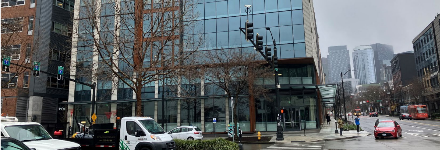
Block 38 West (2023年2月)