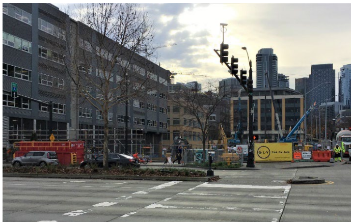
2019年12月Block 38 West地产上的施工进度