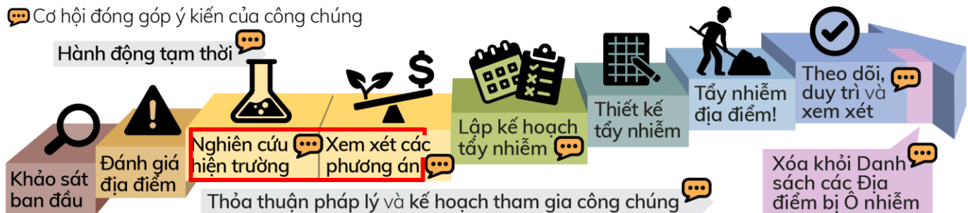
Quy trình dọn dẹp chính thức của Washington