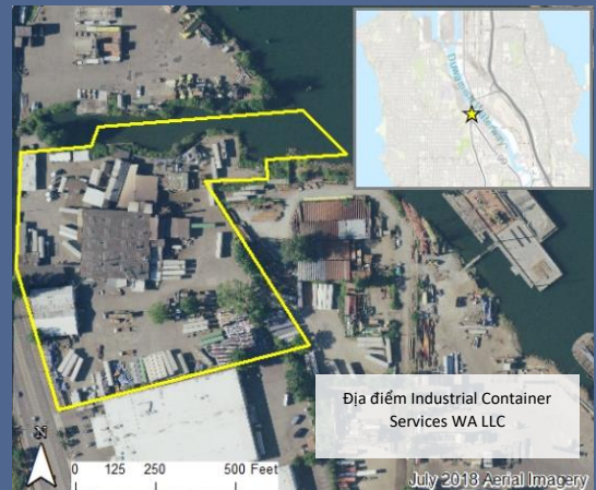
Bản đồ nhìn từ trên không của địa điểm cần dọn dẹp Industrial Container Services WA LLC.

Để yêu cầu điều chỉnh hợp lý theo Đạo Luật Người Khuyết Tật Hoa Kỳ (Americans with Disabilities Act, ADA), hãy liên hệ với Ecology qua số điện thoại 425-229-3683, địa chỉ email LDW@ecy.wa.gov hoặc trang web ecology.wa.gov/Accessibility . Để sử dụng Dịch Vụ Chuyển Tiếp hoặc Điện Báo (TTY), hãy gọi 711 hoặc 877-833-6341.