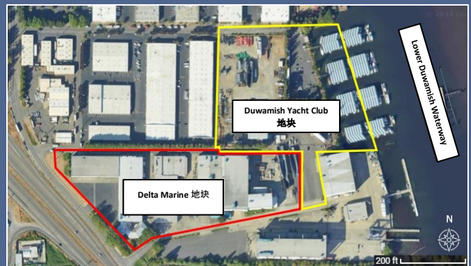
Delta Marine Industries 清理整治场地 鸟瞰图

如需申请 ADA 特殊照顾，请致电 425-533-5537 联系 Ecology，或发送电子邮件至 LDW@ecy.wa.gov 或访问 ecology.wa.gov/Accessibility 。中继服务或 TTY 请拨打 711 或 877-833-6341。