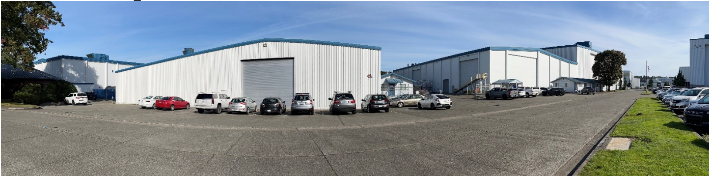
Ubicación del Sitio de limpieza Delta Marine Industries