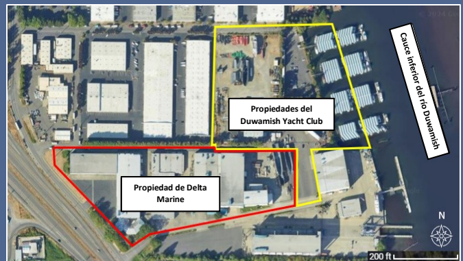
Mapa aéreo del sitio de limpieza de Delta Marine Industries

Para solicitar una adaptación en virtud de la Ley para Estadounidenses con Discapacidades (Americans with Disabilities Act, ADA), comuníquese con Ecology por teléfono al 425-533-5537, envíe un correo electrónico a LDW@ecy.wa.gov o visite ecology.wa.gov/accessibility . Para solicitar el servicio de retransmisión o TTY, llame al 711 o 877-833-6341.