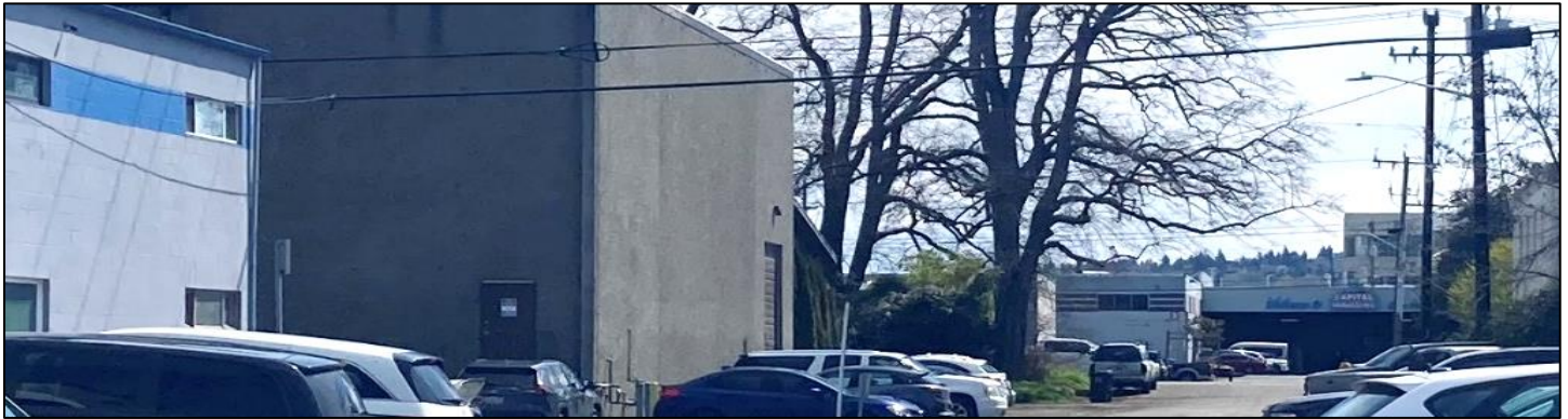
图 1: 位于 Georgetown 西四街的电镀黄铜艺术公司 (Art Brass Plating)、Blaser 压铸厂 (Blaser Die Casting) 和 Capital 金属铸造公司 Capital Industries )