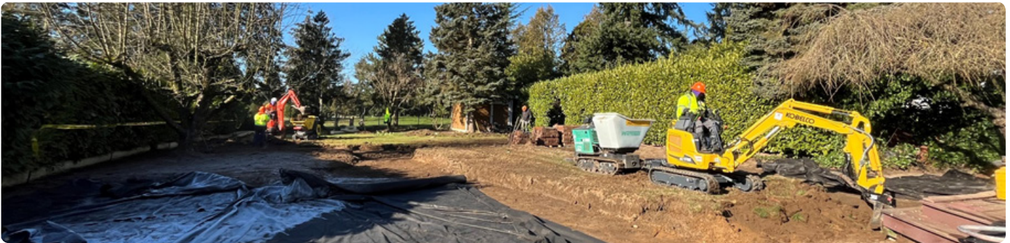
Thi công nhóm tẩy nhiễm năm 2022.