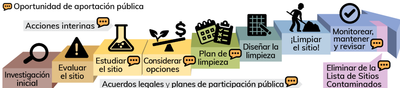
Figura 1: Proceso de limpieza de Washington. Lea la versión en texto simple . 1