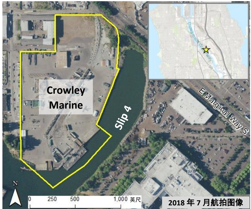
Crowley Marine 清理现场俯瞰图

该场地占地约 16 英亩，是一处工业滨水地产。在 20 世纪初 Duwamish River 河道化改造之前，该区域曾是农业用地和开阔的田野牧场。自 20 世纪初以来，该区域一直用于各种工业和制造活动，包括锯木厂作业以及管道和链条制造。场地的东南部包含 Duwamish River 在河道化改造之前的原有河道路径。这个部分现在被称为 Slip 4。