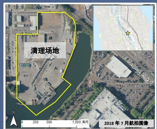
Crowley Marine 清理现场俯瞰地图。

如需申请 ADA 便利服务，请致电 425-533-5537 或发送邮件至 LDW@ecy.wa.gov 联系我们，也可访问 ecology.wa.gov/Accessibility 。中继服务或 TTY 请拨打 711 或 877-833-6341。