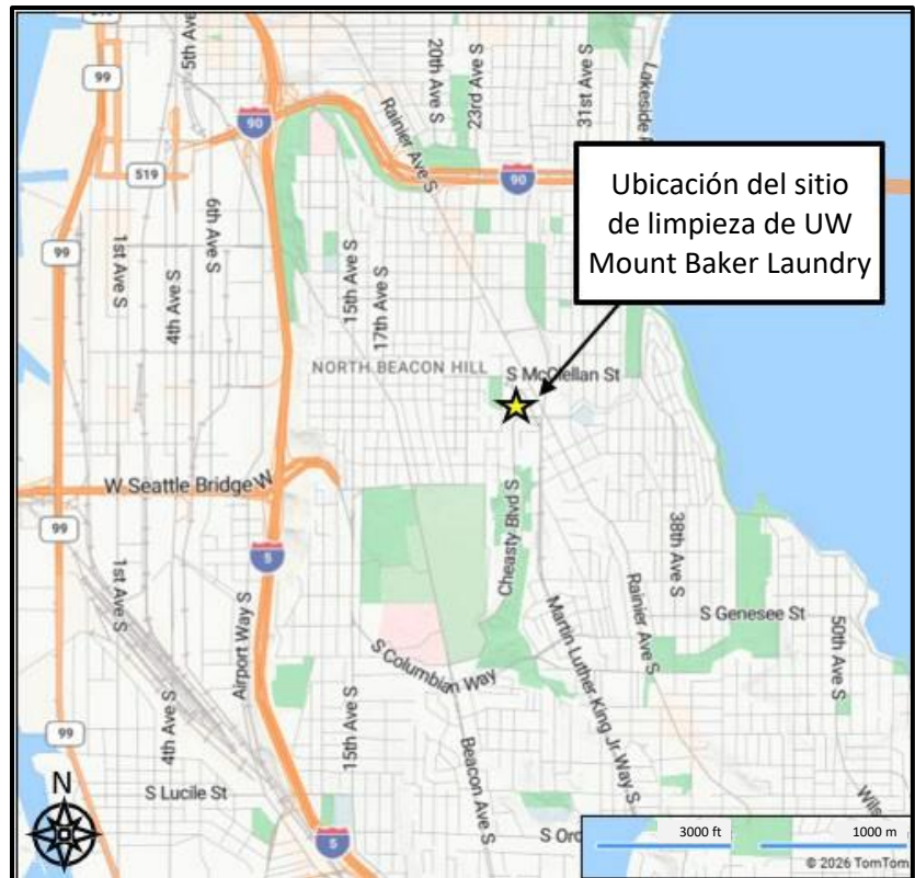
Imagen 1: mapa del sitio en Seattle (2901 27th Ave South)

Otro edificio de la propiedad albergó anteriormente varios negocios de comestibles y de venta minorista antes de ser demolido en 2025 para preparar la reurbanización.