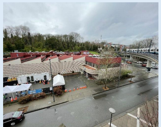
Sitio de limpieza de UW Mount Baker Laundry

Escanear para obtener información y suscribirse