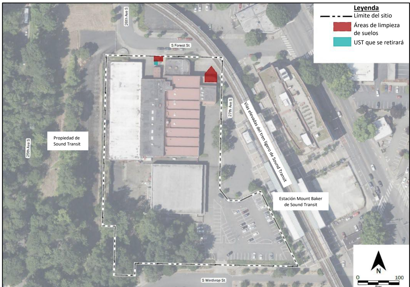
Imagen 2: plan de acción de limpieza del sitio, con las áreas de recuperación 1 y 2 en rojo.