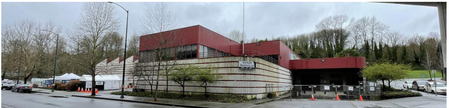
Sitio de limpieza de UW Mount Baker Laundry