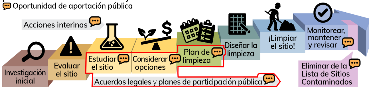
Imagen 3: proceso de limpieza formal de Washington.