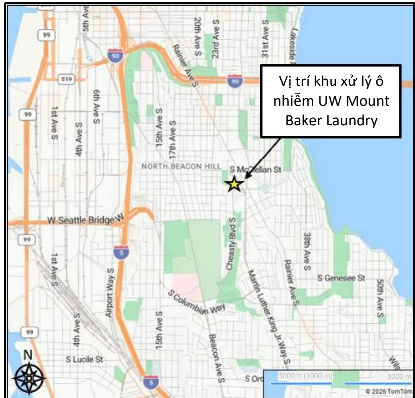
Hình 1: Bản đồ khu đất tại Seattle (2901 27 th Ave South)

Một tòa nhà khác trên khu đất trước đây từng là nơi hoạt động của nhiều cửa hàng tạp hóa và bán lẻ, sau đó bị phá dỡ vào năm 2025 để chuẩn bị tái phát triển.