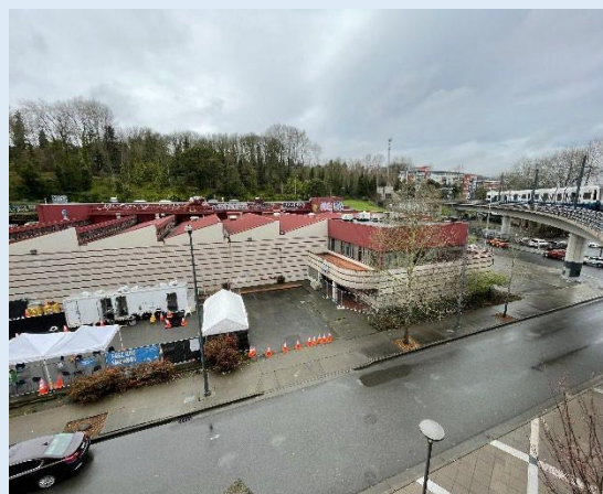
Khu xử lý ô nhiễm UW Mount Baker Laundry