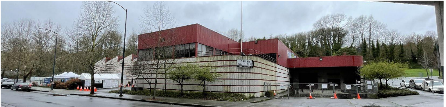
Khu xử lý ô nhiễm UW Mount Baker Laundry