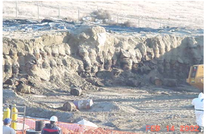
Removimiento de los Barriles en la Zona B

El objetivo de la actual acción interina en la Zona B es el de construir una mejor cubierta protectora o capa sobre la cubierta temporal. Se anticipa que la nueva cubierta que se propone será la cubierta final. Ésta es diseñada para cumplir con los requisitos federales de sistemas de cubiertas para rellenos sanitarios.