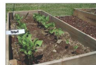
Trồng hoa và cây kiềng trong bồn.

Nếu quý vị muốn có tài liệu này trong một thể dạng khác, xin liên lạc số điện thoại 425-649-7000. Quý vị có khuyết tật nghe, xin gọi 711 đến Washington Relay Service. Khuyết tật nói, xin gọi số 877-833-6341.