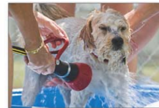
Giữ thú nuôi sạch sẽ