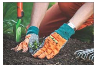
Mang bao tay khi làm vườn

Nếu quý vị sống trong khu vực liên quan đến hoạt động làm sạch nhà máy luyện kim Everett, hãy dùng mọi phương cách để bảo vệ người thân từ đất ô nhiễm