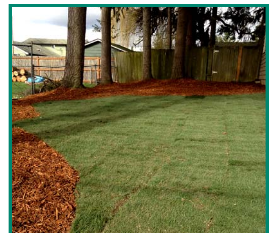
Bộ Môi Sinh đã làm việc để loại bỏ đất ô nhiễm-thạch tín tại Bắc Everett từ năm 1999.

Nếu quý vị muốn có tài liệu này trong một thể dạng khác, xin liên lạc số điện thoại 425-649-7000. Quý vị có khuyết tật nghe, xin gọi 711 đến Washington Relay Service. Khuyết tật nói, xin gọi số 877-833-6341.