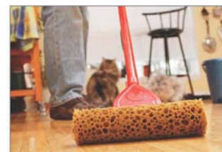
Lau nhà thường xuyên