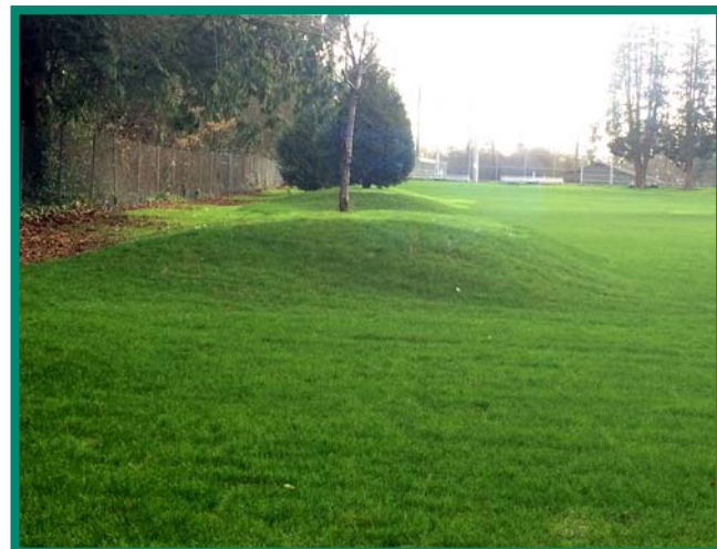
Bộ Môi Sinh đã di dời đất nhiễm tại công viên American Legion và thay thế bằng đất sạch, phục hồi sân cỏ và cây trồng.