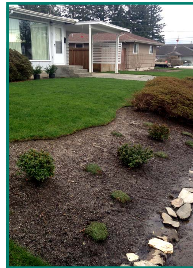
Khu vườn của dân cư được phục hồi trong năm 2015.

Cám ơn quý vị đã tham gia đóng góp ý kiến cho bản báo cáo môi trường ở vùng đất thấp (Lowlands Area Environmental Reports) vào tháng 10 và 11 năm 2015. Chúng tôi đã xem xét thông tin phản hồi và hoàn thiện bản báo cáo này. Cơ hội tiếp là giai đoạn đóng góp ý kiến cho bản thảo kế hoạch dọn sạch (Draft Cleanup Action Plan) dự kiến vào mùa hè này.