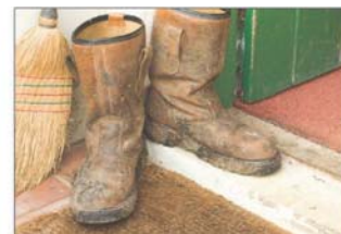
Cởi giày dép trước khi vào nhà