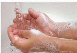
Rửa tay sau khi chơi hoặc làm việc ngoài vườn