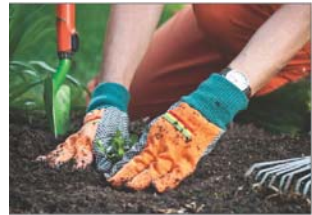
البس قفازات اثناء العمل في الحديقة