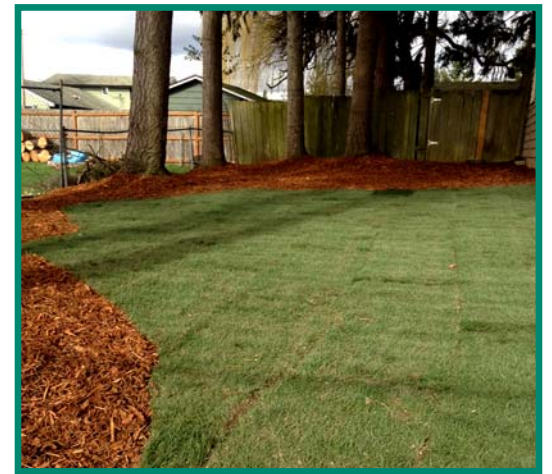
كان يعمل قسم البيئة على ازالة تربة الزرنوخ- الملوثة في شمال افريت منذ 2009

نحن نشطين في السعي للحصول على أموال من الولاية لدعم تنظيف العقارات والحدائق في المستقبل. سنستمر في ابلاغكم بالجديد في التقدم بينما نتحرك للأمام في المشروع.