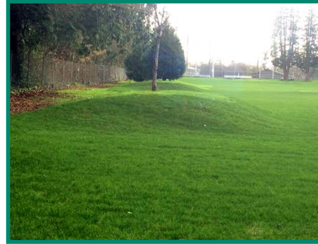
البيئة ازال التراب الملوث من حديقة امريكن ليجون ماموريال واستبدلتها بتربة نظيفة واستعادة العشب