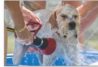
احفظ الحيوانات نظيفة