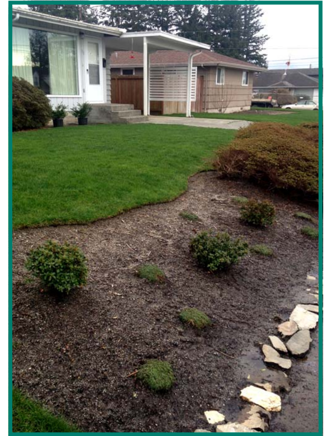
مجموعة تنظيف للعقارات السكنية المجددة حديثاً في

نشكر لجميع من شارك في فترة التعليق العام للتقارير البيئية للمساحات المنخفضة في اكتوبر-نوفمبر 2015. نحن نستعرض ردود الفعل ووضعنا اللامسات الاخيرة لهذه التقارير. الفرصة التالية للمشاركة ستكون فترة تعليق على مشروع خطة عمل التنظيف المقررة لهذا الصيف. ترقبوا!