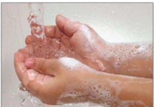
اغسل يديك بعد اللعب او العمل