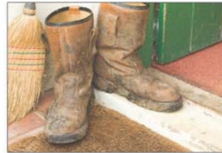
اترك احذيتك المتسخة عند الباب