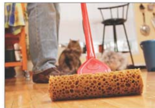
قم بمسح الغبار كثيراً