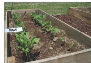
ازرع ورود ونباتات في اوانى

نحن نحرز تقدم لكن هناك المزيد للقيام به منذ عام 2011، قام المشروع بأخذ عينات من اكثر من 400 عقار وبتنظيف اكثر من 300 عقار سكنى.