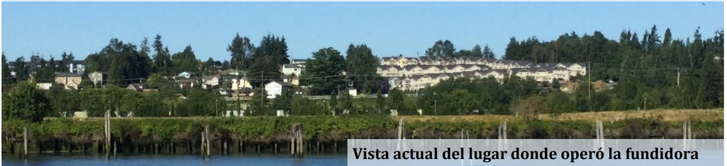
Vista actual del lugar donde operó la fundidora