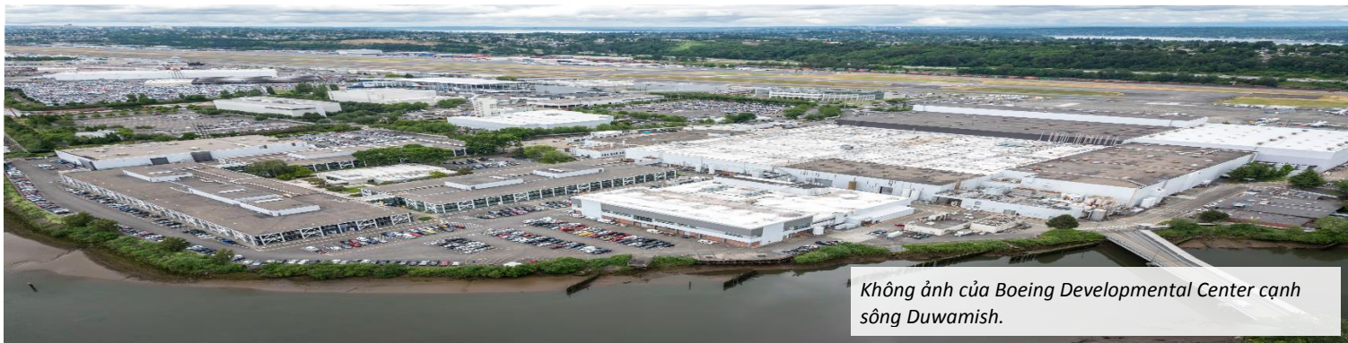
Không ảnh của Boeing Developmental Center cạnh sông Duwamish.