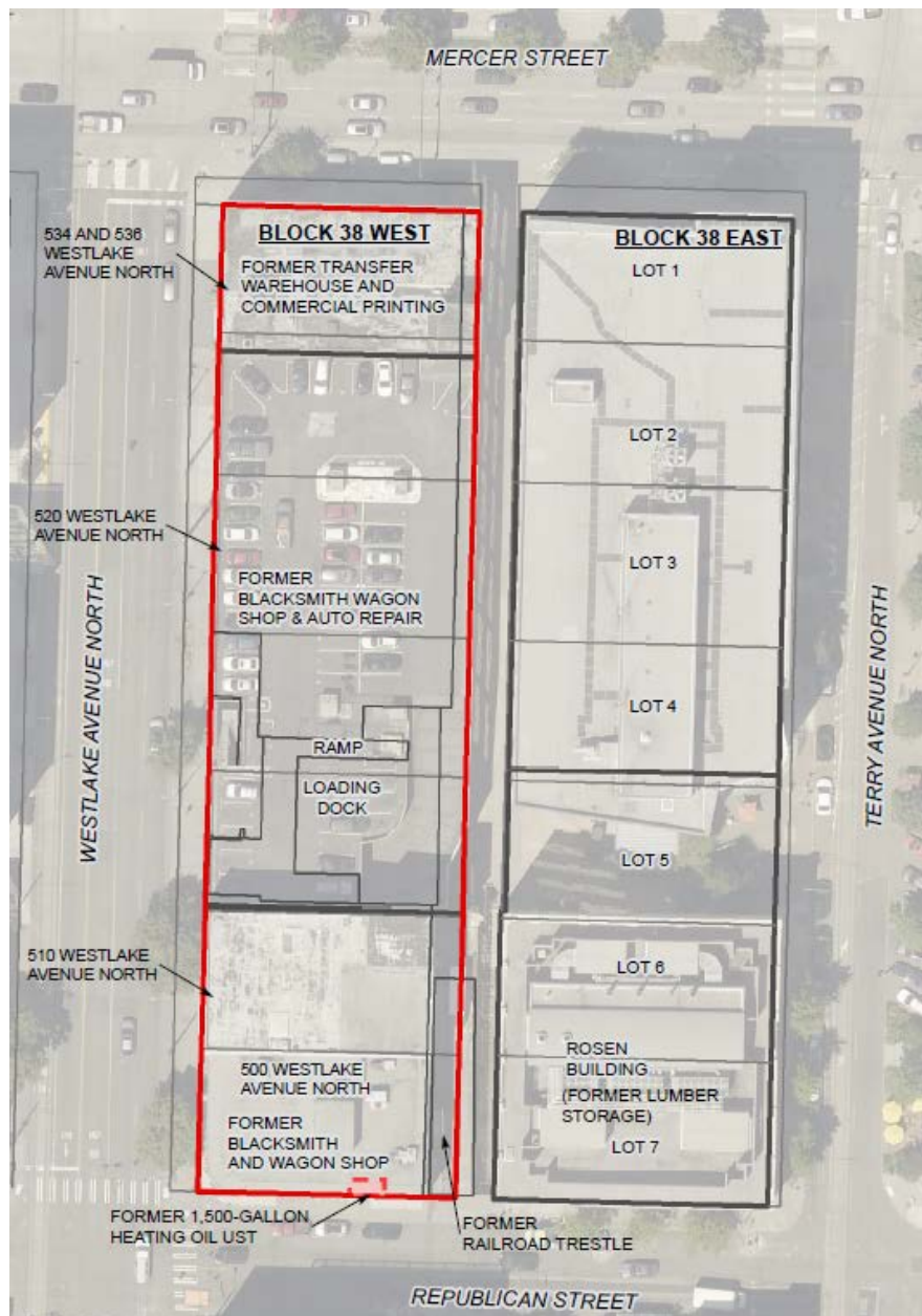
Figura 1: Mapa de la propiedad Block 38 West con características históricas. (Farallon 2019).

Una acción de limpieza independiente (sin supervisión de Ecología) asociada a la remodelación se está llevando a cabo actualmente en el Sitio.