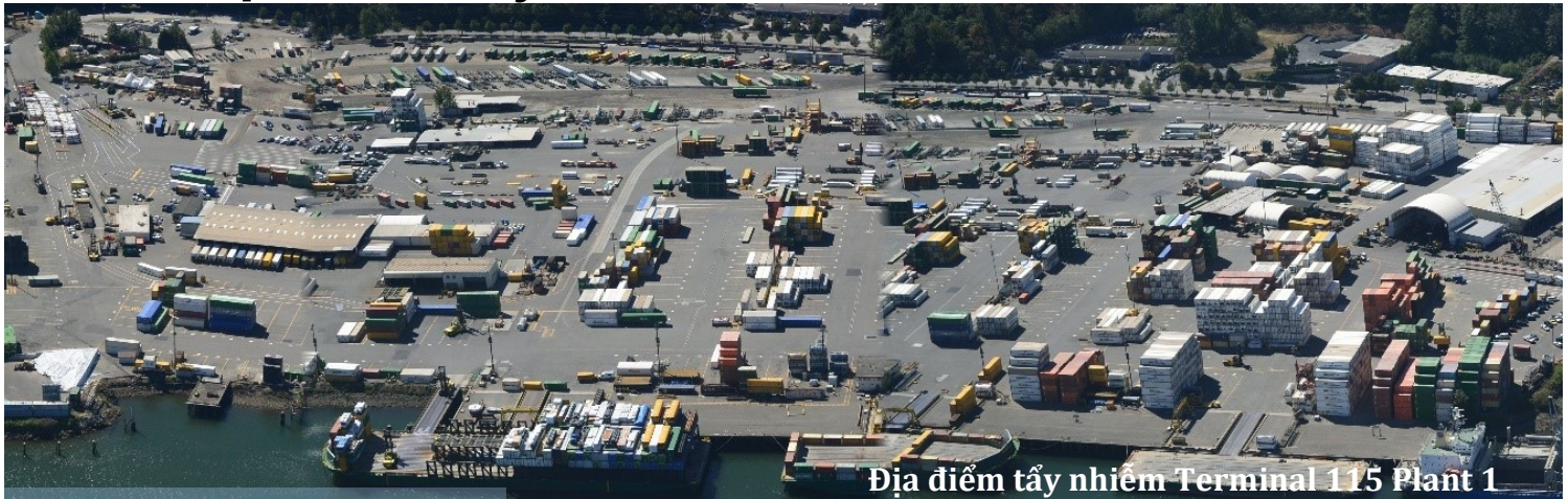
Địa điểm tẩy nhiễm Terminal 115 Plant 1