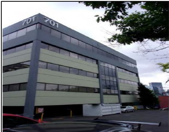
Vista del Sitio de Limpieza 701 Dexter