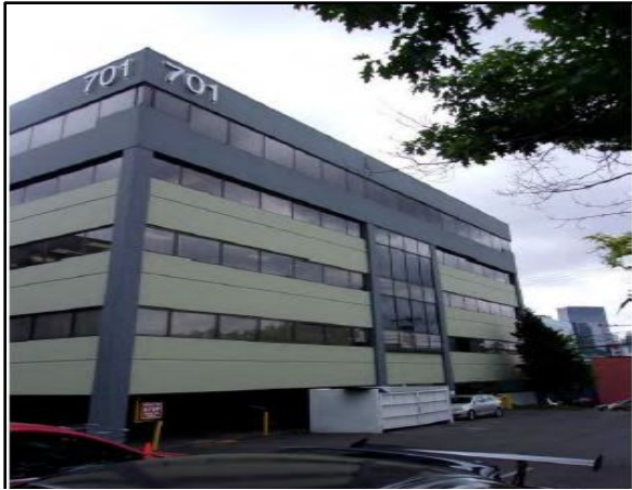
701 Dexter 清理站點圖