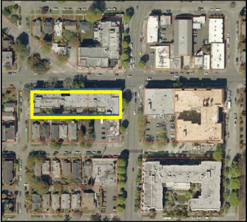
የ የአየር ላይ ምስል።