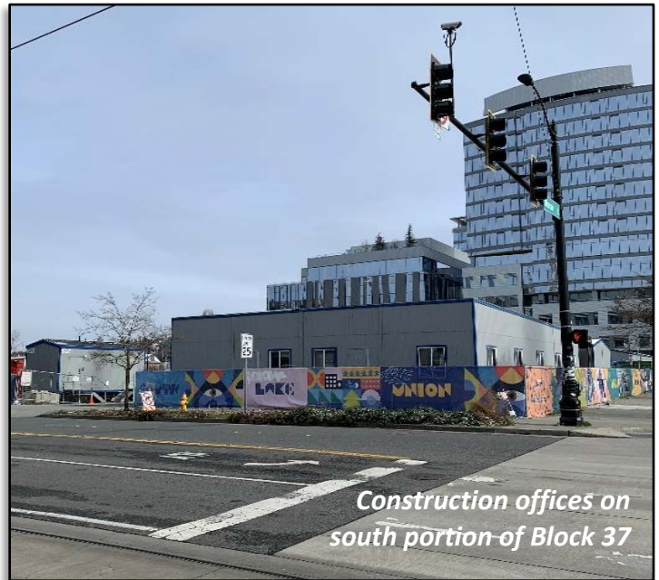
Construction offices on south portion of Block 37

Block 37目前沒有永久性建築物。南部大部分被礫石覆蓋，用於附近的重建項目的臨時工地辦公室、設備、物資儲存和臨時水處理設施。北部已鋪好，主要用作停車場和設備存放處。