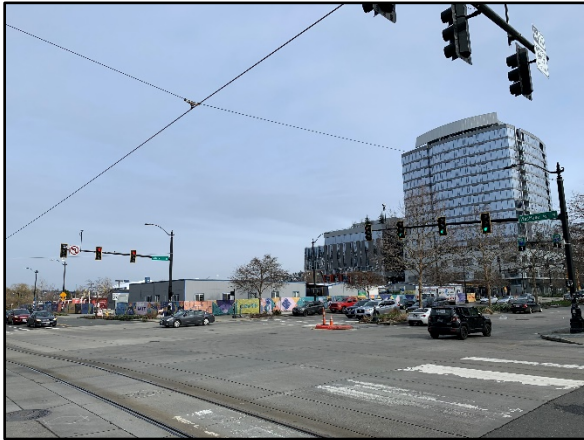
Northeast view of the Block 37 Cleanup Site