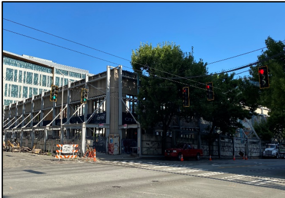
Seattle Times Cleanup Site