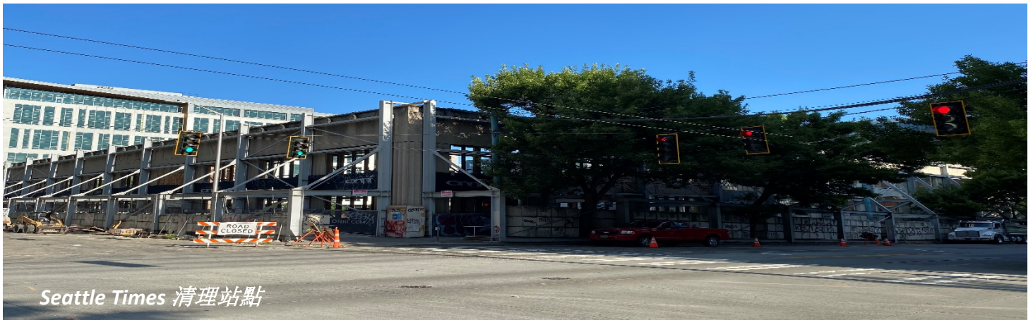
Seattle Times 清理站點