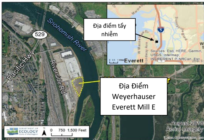
Địa điểm tẩy nhiễm nhìn từ trên không