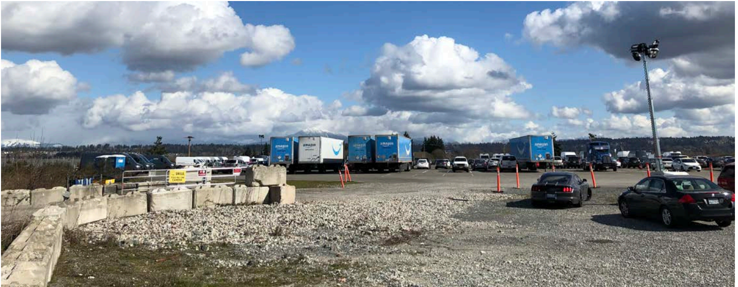
Địa điểm tẩy nhiễm hướng về phía đông, tháng 3 - 2020