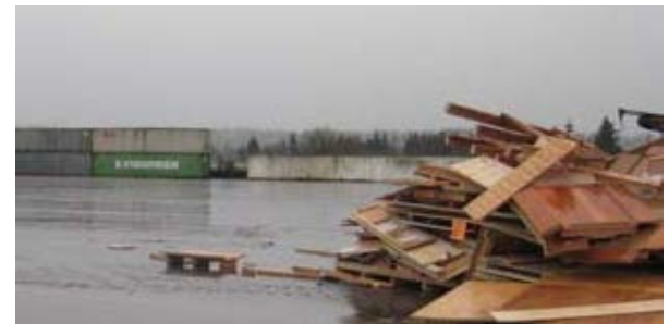
Nơi lưu trữ Pallet và thùng chứa hàng tại địa điểm sau khi hoàn thành tẩy nhiễm ban đầu.