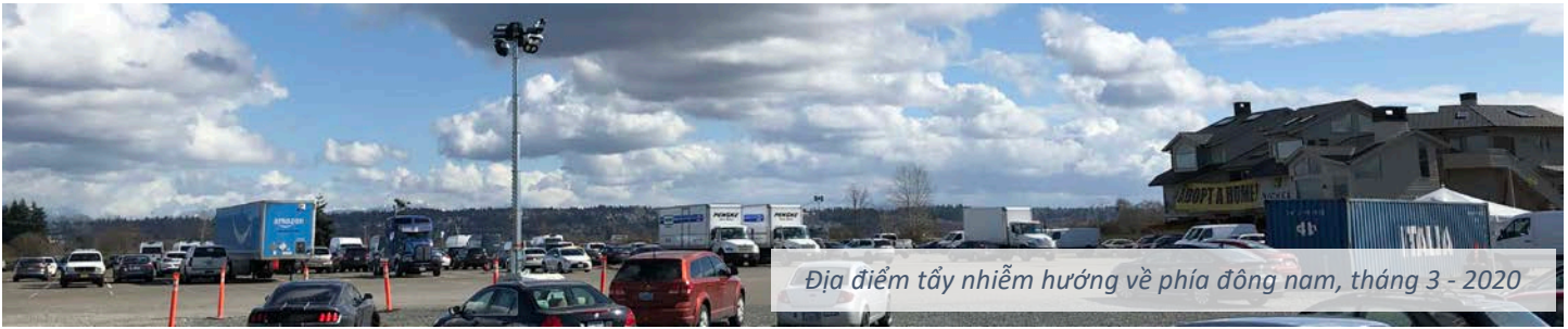
Địa điểm tẩy nhiễm hướng về phía đông nam, tháng 3 - 2020