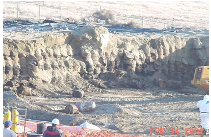
Removimiento de los Barriles en la Zona B

El objetivo de la actual acción interina en la Zona B es el de construir una mejor cubierta protectora o capa sobre la cubierta temporal. Se anticipa que la nueva cubierta que se propone será la cubierta final. Ésta es diseñada para cumplir con los requisitos federales de sistemas de cubiertas para rellenos sanitarios.