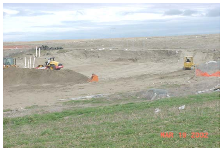
Después de Remover los Barriles de la Zona B