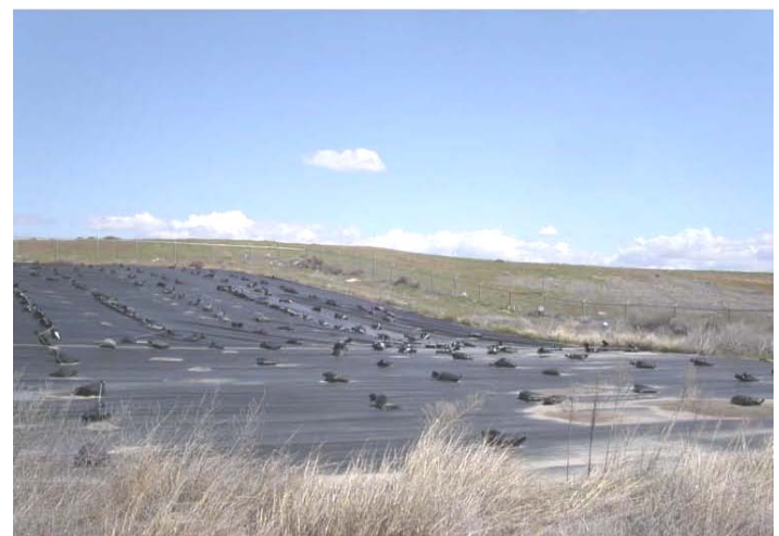
Cubierta Temporal en la Zona B del Relleno Sanitario