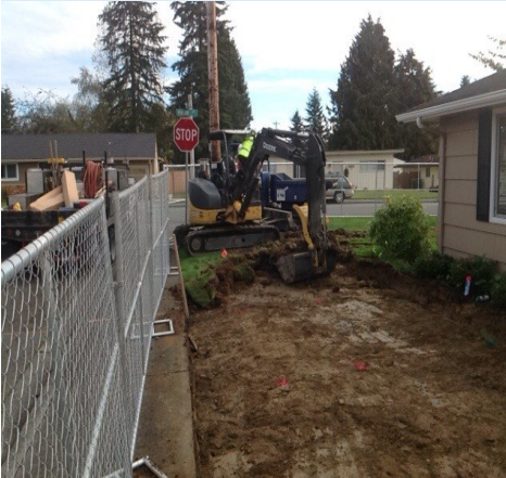
Figura 4: Rellenando con suelo limpio