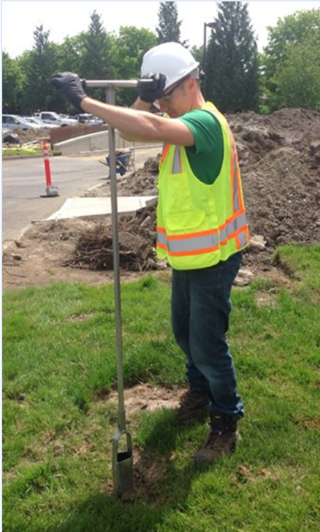
Figura 6: Muestreo del suelo