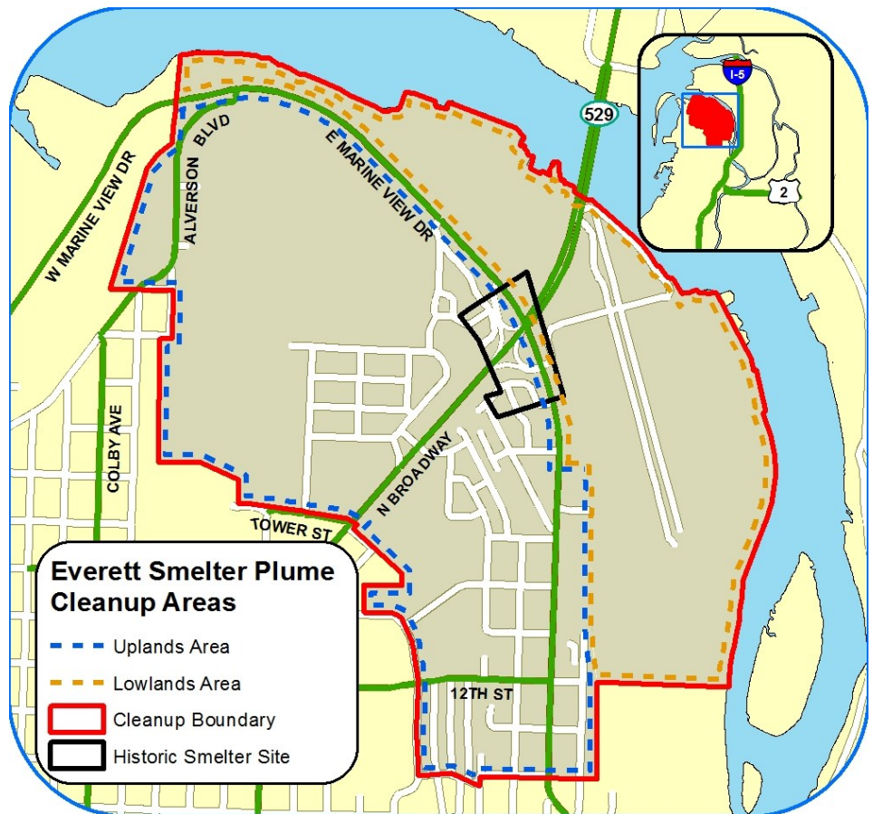
Figura 1: Sitio de Limpieza de la Fundidora de Everett

El sitio de limpieza está dividido en dos áreas de limpieza: Tierras Altas (residencial) y Tierras Bajas (industrial/comercial). Las dos áreas tienen diferentes horarios de limpieza.