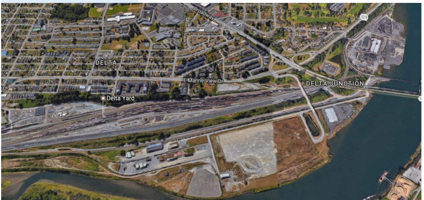
Figura 7: Tierras Bajas

La primera fase es remover material altamente contaminado que está enterrado debajo de la intersección de East Marine View Drive y la entrada norte a la carretera estatal 529. Necesitamos remover este material porque está contaminando el agua subterránea que entra al Río Snohomish.