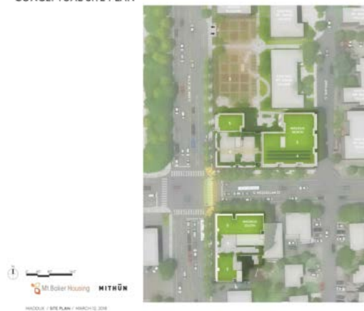
Hình 1 Bản kế hoạch khái niệm địa điểm cho thấy các vị trí phát triển Mount Baker.