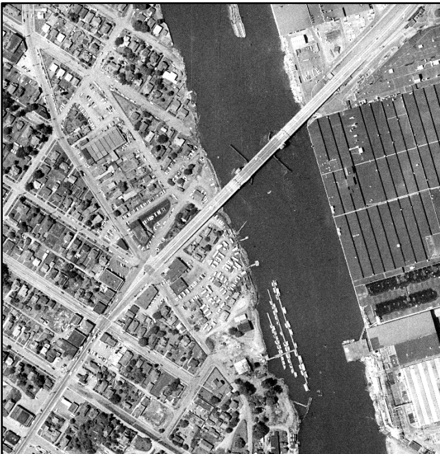
Foto histórica de South Park Marina