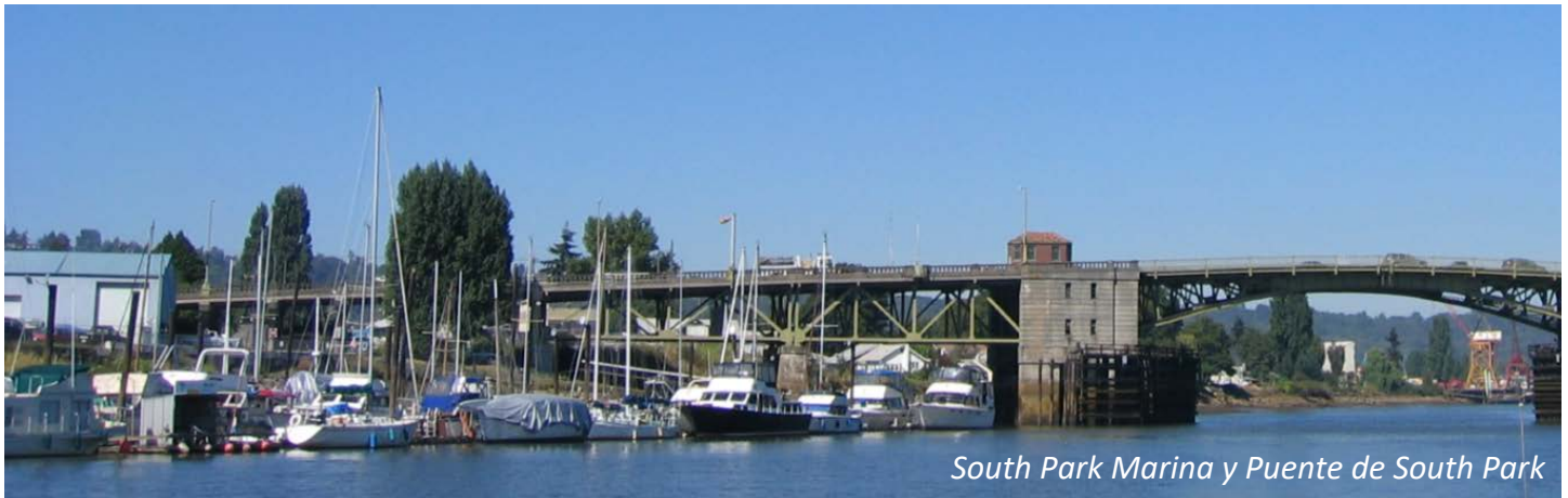
South Park Marina y Puente de South Park