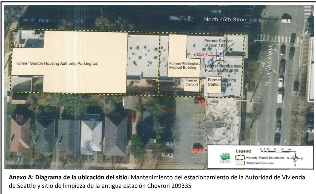
Anexo A: Diagrama de la ubicación del sitio: Mantenimiento del estacionamiento de la Autoridad de Vivienda de Seattle y sitio de limpieza de la antigua estación Chevron 209335

Si no se realizan cambios significativos después los comentarios públicos, se finalizarán los documentos y se avanzará con el proceso de limpieza.