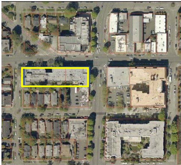
Imagen aérea de Stone Way Apartments.