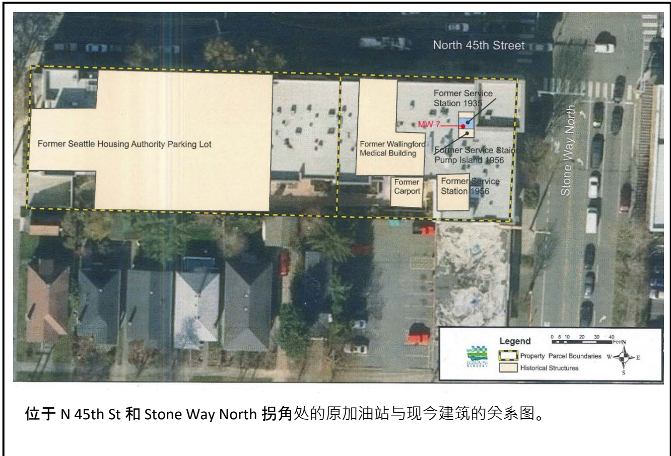
位于 N 45th St 和 Stone Way North 拐角处的原加油站与现今建筑的关系图。