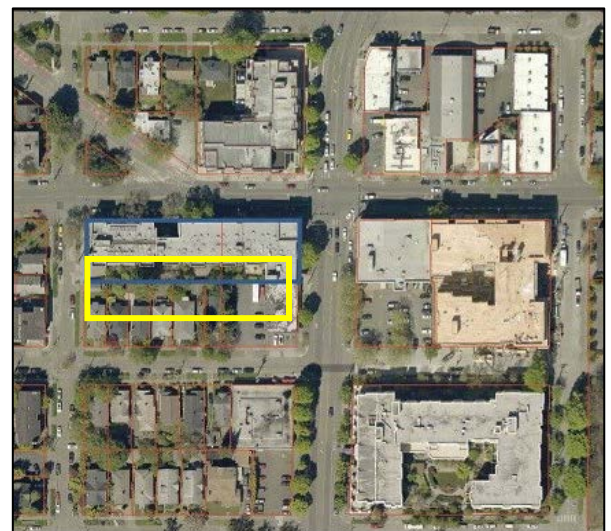
Stone Way Apartments 的航拍图像。