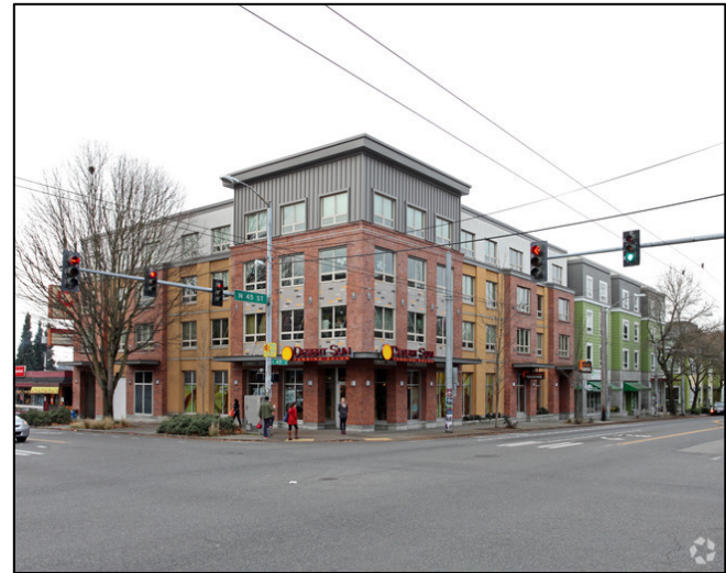
Stone Way Apartments.

至少从 1935 年开始，一家服务站在该场所经营。Standard Oil Company (Standard) (Chevron U.S.A. Inc. 的前身) 于 1954 年购买了该场所，并经营一家加油站，直到 1969 年服务站大楼和服务站车库被拆除。Standard 在 1978 年将该场所卖给了西雅图住房管理局 (Seattle Housing Authority, SHA)。SHA 于 2005 年将该场所卖给了 Housing Resources Group (HRG)，Housing Resources Group 又