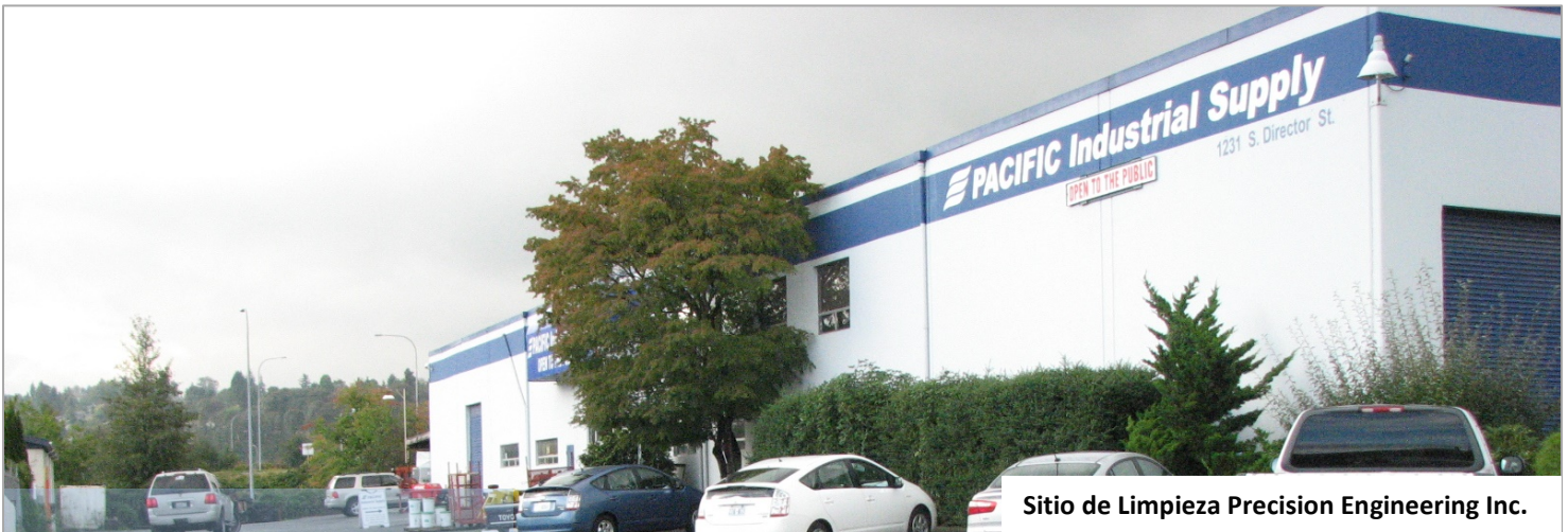
Sitio de Limpieza Precision Engineering Inc.