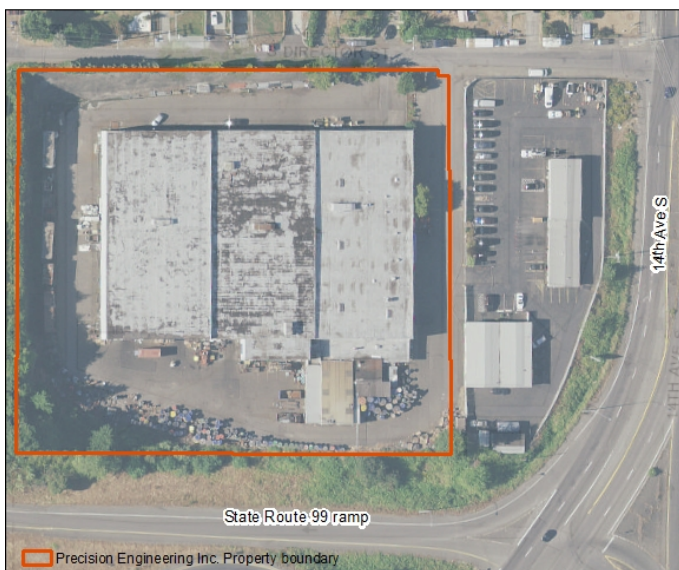
Vista del sitio Precision Engineering Inc.