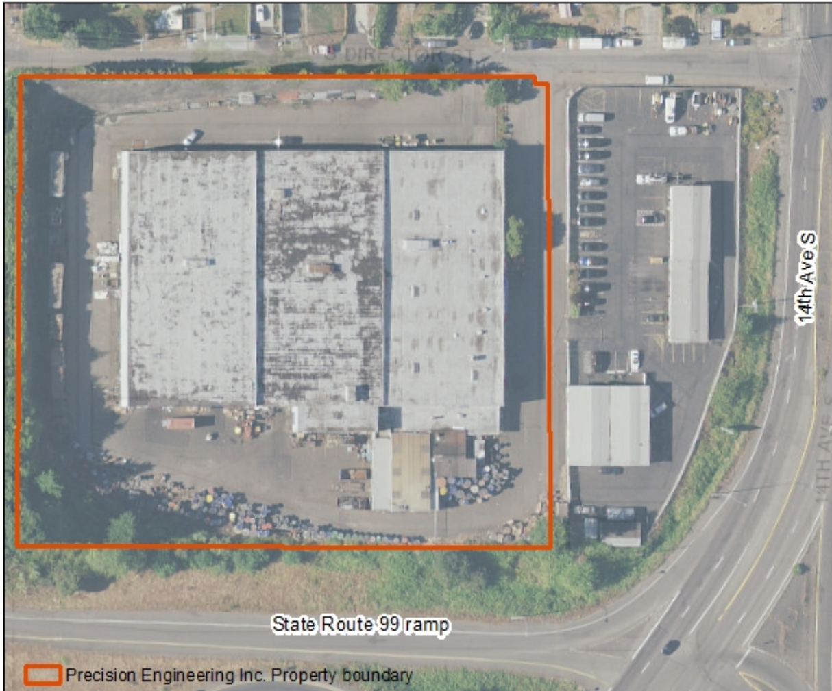
Vista aérea del sitio Precision Engineering Inc.

Precision Engineering Inc. operó un taller de mecánica pesada y servicio de reparación de equipo en esta localidad del 1968 hasta el 2005. Actividades incluyeron, triturar y pulir, afilar, enchape duro en cromo, moler, soldar, y otros enchapes en metal aplicados con flama y arco. Este trabajo envolvía el uso de sustancias químicas, en particular el ácido crómico para el enchape y tricloroetileno como solvente.