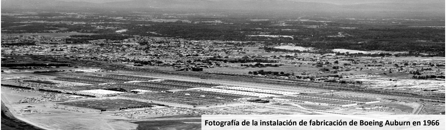
Fotografía de la instalación de fabricación de Boeing Auburn en 1966