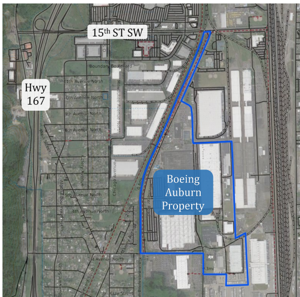
Figure 2: Ubicación del sitio de fabricación de Boeing Auburn