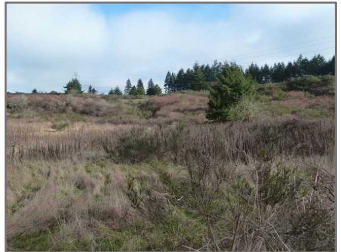
La propiedad es un terreno baldío, no-urbanizado cubierto con arbustos y árboles.