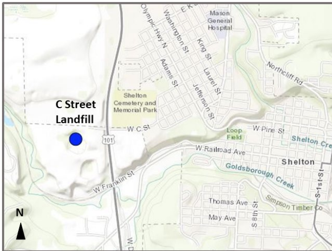
El relleno sanitario está al suroeste de la intersección de West C Street y US Highway 101.

Próximos Pasos: Ecología considerará los comentarios recibidos durante el periodo de comentario. Si no hay cambios, entonces Ecología aprobará los documentos de limpieza y firmará la AO. La ciudad hará el trabajo de limpieza.