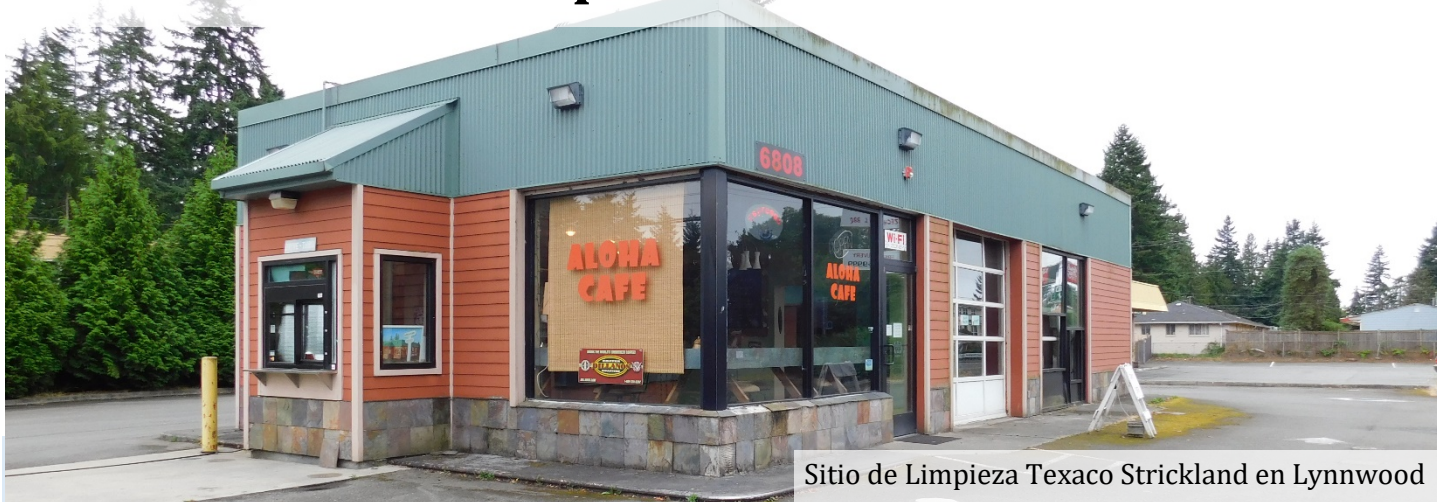
Sitio de Limpieza Texaco Strickland en Lynnwood

Se aceptarán comentarios: 6 de julio al 4 de agosto del 2021 Envíe sus comentarios