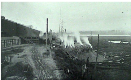
La fundición Asarco en operación alrededor de 1900.

1990: El Departamento de Ecología descubrió arsénico, plomo, cadmio y otros metales en el suelo alrededor de North Everett. Esta contaminación proviene de la fundición de Everett, que operó desde 1894 a 1912.