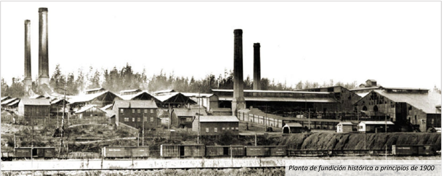
Planta de fundición histórica a principios de 1900