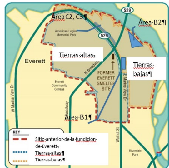
Mapa del proyecto de limpieza de la fundición de Everett. La planificación de las acciones de limpieza en las Áreas B1, B2, C2 y C3 comienza este año.