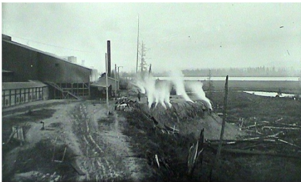
Работа металлургического комплекса Asarco приблизительно в 1900 г.

1990 г.: департамент экологии обнаружил мышьяк, свинец, кадмий и прочие металлы в почве в районе North Everett. Эти загрязнения возникли в результате работы металлургического комплекса Everett, эксплуатировавшегося с 1894 по 1912 гг.