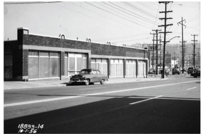
1956年10月1日地塊南部，西雅圖市政檔案館照片

該站點位於西雅圖Lake Union南面，離Lake Union一個街區，它由金郡 (King County) 四塊地產組成。這些地塊位於Lake Union歷史範圍內，1900年代早期部分填埋成為該區一部分。在1920-2019年間站點有汽車陳列室及各類車輛服務中心。原建築2021年拆除，準備用於再開發。目前該處是附近施工的臨時停車場。