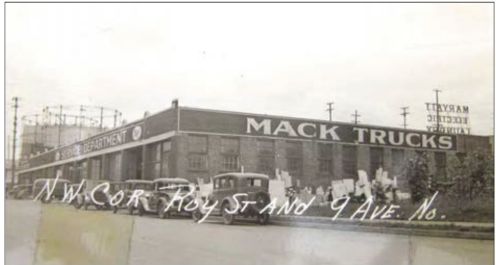
1937年歷史照片顯示此處為Mack卡車服務中心和陳列館。

如無改動，生態署最終敲定文件，PLP繼續進行RI、FS、初步dCAP及所有臨時清理工作。