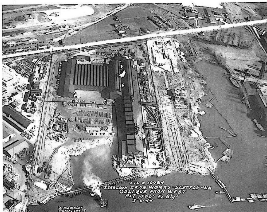
Địa điểm Jorgensen Forge Corp nhìn từ trên không (nhìn về phía đông) vào năm 1944.

Tất cả những chất gây ô nhiễm này đều được tìm thấy ở mức độ cao hơn luật tẩy nhiễm của tiểu bang, Mô Hình Kiểm Soát Chất Độc Hại ( MTCA 1 ). MTCA quy định các chất gây ô nhiễm này phải được tẩy nhiễm.