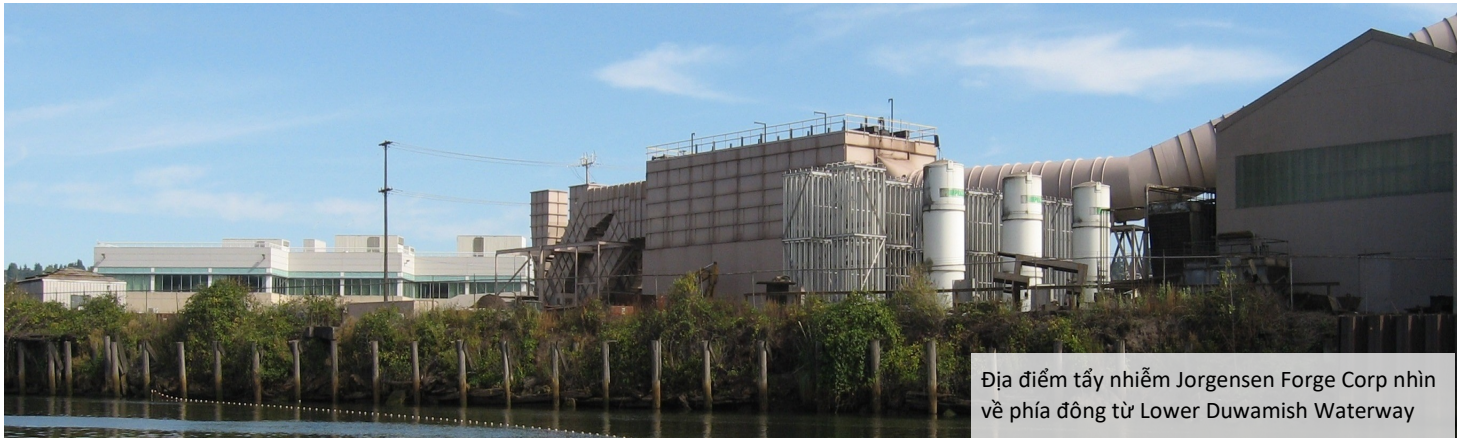
Địa điểm tẩy nhiễm Jorgensen Forge Corp nhìn về phía đông từ Lower Duwamish Waterway