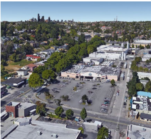
Vista aérea del Sitio de Limpieza de Rainier Mall