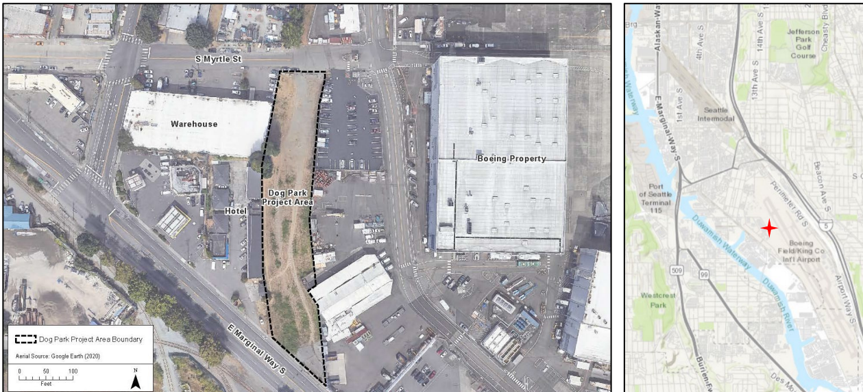
Không ảnh và bản đồ của Địa Điểm Nhà Máy Hơi Nước North Boeing Field Georgetown và Khu Vực Dự Án Công Viên Chó..

Khu Vực Dự Án Công Viên Chó nằm vị trí hướng cuối nam của Nhà Máy Hơi Nước Georgetown Flume. Flume là hệ thống ống và mương thoát nước dẫn nước thải từ nhà máy hơi nước lịch sử đến Slip 4 của Lower Duwamish Waterway (LDW) cho đến những năm 1960. Khu Vực Dự Án Công Viên Chó trước đây cũng có trạm biến áp điện Ellis Ave và đã được dỡ bỏ cùng hệ thống thải nước vào năm 2009. Hiện tại, Khu Vực Dự Án Công Viên Chó là một khu đất chưa phát triển được bao phủ bởi thảm thực vật, đất trống và sỏi. Hành động tạm thời này sẽ cho phép công chúng sử dụng Khu Vực Dự Án Công viên Chó trong khi Nghiên Cứu Khả Thi và Khảo Sát Phục Hồi trên toàn Khu được hoàn thành.