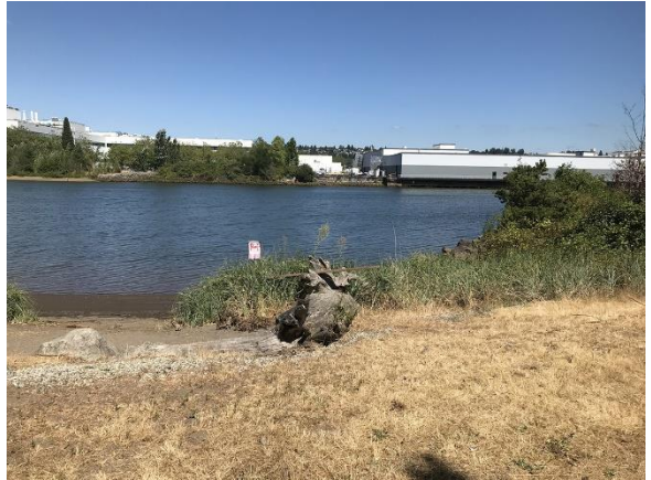
ከ Duwamish Waterway Park የታችኛው የ Duwamish የውሃ ተፋሰስ እይታ፣ ኦገስት 2022

የ Duwamish Waterway Park ጣቢያው ከታችኛው Duwamish የውሃ ተፋሰስ 4 ስፕሪንግ ጣቢያ አጠገብ ነው። ይህም የ Duwamish ወንዝ 5 ማይልን ያካትታል። የ U.S. የአካባቢ ጥበቃ ኤጀንሲ (Environmental Protection Agency, EPA) በ 2001 የ LDW Superfund Site 5 ን ወደ Superfund ብሄራዊ ቅድሚያ የሚሰጣቸው ነገሮች ዝርዝር ውስጥ አካል ነው። ኢኮሎጂ የብክለት ምንጮች ወደ LDW Superfund Site እንዳይገቡ ለማቆም ወይም ለመቀነስ እየሰራ ነው። ይህም ጥረት “ ምንጭ ቁጥጥር 6 ” በመባል ይታወቃል። ይህም EPA የወንዙን ደለል በማጽዳት እንዲቀጥል ነው።