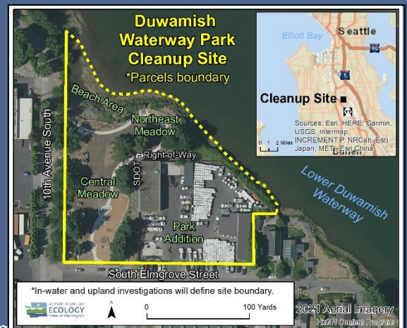
Mapa aéreo del sitio de limpieza de Duwamish Waterway Park, 2021

Para solicitar una adaptación de la ADA, comuníquese con Ecología por teléfono al 425-324-5901 o envíe un correo electrónico LDW@ecy.wa.gov , o visite ecology.wa.gov/Accessibility . Para servicio de retransmisión o TTY, llame al 711 o al 877-833-6341.