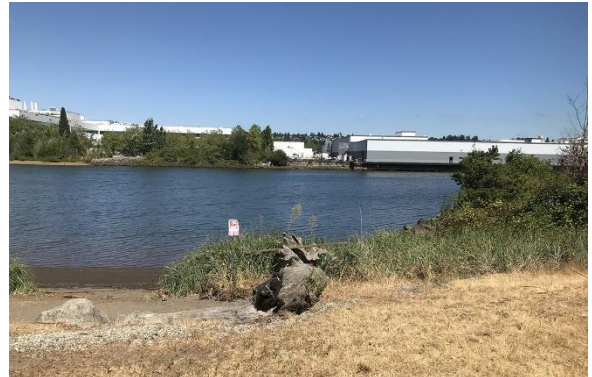
Vista del Lower Duwamish Waterway desde el Parque Duwamish Waterway, agosto de 2022

El sitio de Duwamish Waterway Park se encuentra adyacente a Lower Duwamish Waterway 4 Superfund Site, que incluye un tramo de 5 millas del río Duwamish. La Agencia de Protección Ambiental de los Estados Unidos (EPA, por sus siglas en inglés) agregó el sitio LDW Superfund 5 a la Lista de Prioridades Nacionales de Superfund en 2001. Ecología está trabajando para detener o reducir las fuentes de contaminación al sitio LDW Superfund, un esfuerzo conocido como “ control de fuentes ” 6 , para que la EPA pueda proceder con la limpieza del sedimento del río.