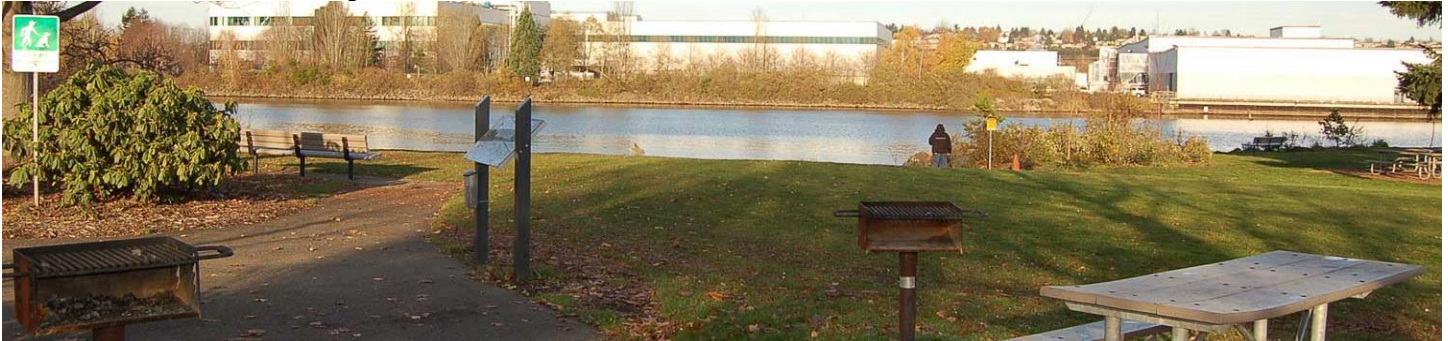
Shoreline នៅឧទ្យានផ្លូវទឹកឌុយ៉ាមីស ( Duwamish Waterway Park ) ទីក្រុងតំណាងស្តីតថល