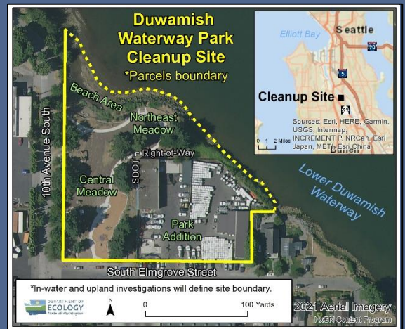
ទិដ្ឋភាពពីលើអាកាសនៃទីតាំងសម្អាតឧទ្យានផ្លូវទឹកយ៉ាមីស (Duwamish Waterway Park) ឆ្នាំ 2021

សម្រាប់សេវាបញ្ជូនបន្ត ឬ TTY សូមហៅទូរស័ព្ទលេខ 711 ឬ 877-833-6341.