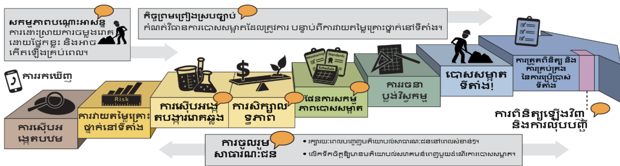
ដំណើរការសម្អាតជាផ្លូវការរបស់វ៉ាស៊ីនតោន Washington (ទាញយកឬដោះស្រាយការពន្យល់អត្ថបទ 10 )

ច្បាប់គ្រប់គ្រងសារធាតុពុលគំរូ ( Model Toxics Control Act ) ( MTCA 7 ) គឺជាច្បាប់សម្អាតបរិស្ថាននៅទីក្រុងវ៉ាស៊ីនតោន Washington។ ច្បាប់នេះផ្តល់ជូនការការពារសម្រាប់ការសម្អាតទីតាំងកខ្វក់ និងកំណត់ស្តង់ដារដែលការពារសុខភាពមនុស្ស និងបរិស្ថាន។ ក្រសួងបរិស្ថានវិទ្យា ( Ecology ) អនុវត្ត ដំណើរការសម្អាត MTCA 8 និងត្រួតពិនិត្យការសម្អាត។