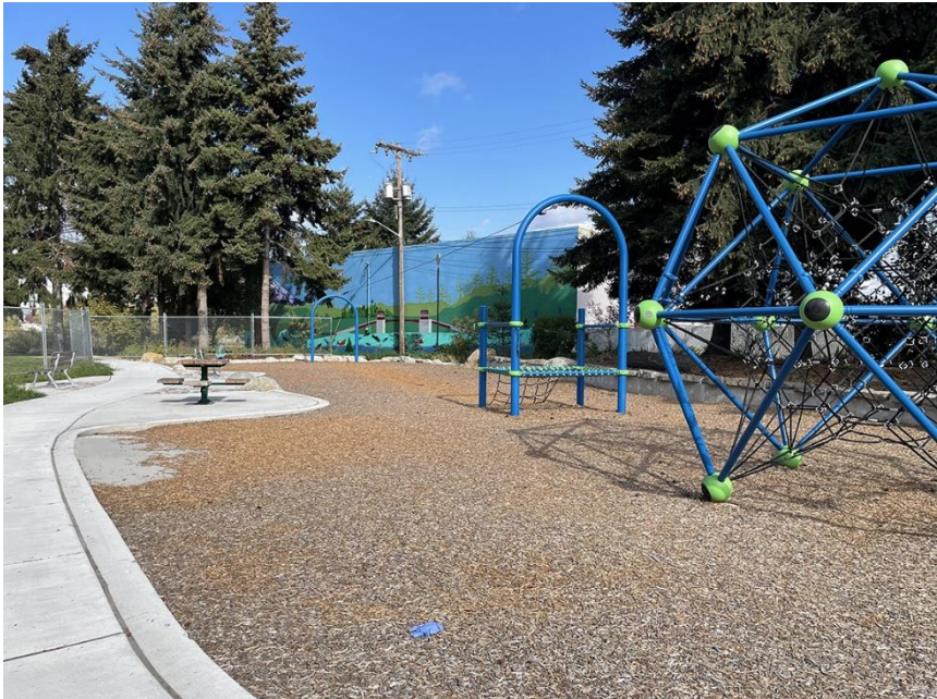
កន្លែងកុមារលេងនៅឧទ្យានផ្លូវទឹកឌុយវ៉ាមីស (Duwamish Waterway Park) ខែកញ្ញា ឆ្នាំ 2022

កម្មវិធីសម្អាតដោយស្ម័គ្រចិត្ត 3 (VCP) អនុញ្ញាតឱ្យម្ចាស់កម្មសិទ្ធិទីតាំងកន្លែងបំពេញតាមស្តង់ដារសម្អាតនៅរដ្ឋក្រាមច្បាប់ MTCA ដោយឯករាជ្យ និងទទួលបានការណែនាំផ្នែកបច្ចេកទេសពីក្រសួងបរិស្ថានវិទ្យា (Ecology) នៅអំឡុងពេលដំណើរការនេះ។ កម្មវិធី VCP អនុញ្ញាតឱ្យម្ចាស់កម្មសិទ្ធិធ្វើការលើមូលដ្ឋានតាមកិច្ចសន្យាជាដាច់ខាតនៅក្រោមបទបញ្ជាផ្ទៃក្នុងរបស់ក្រសួងបរិស្ថានវិទ្យា (Ecology)។ អ្នកចូលរួមកម្មវិធី VCP បង់ថ្លៃសេវាក្រសួងបរិស្ថានវិទ្យា (Ecology) ដើម្បីចេញថ្លៃរ៉ាប់រងការចំណាយរបស់នាយកដ្ឋានសម្រាប់ការណែនាំ និងការពិនិត្យឡើងវិញ។ ទីតាំងកម្មវិធី VCP ត្រូវតែបំពេញតាមស្តង់ដារសម្អាតដូចគ្នានឹងបរិវេណនានាដែលត្រូវត្រងជាផ្លូវការដោយក្រសួងបរិស្ថានវិទ្យា (Ecology) ដែលស្ថិតក្រោមច្បាប់ MTCA។ នៅខែកក្កដា ឆ្នាំ 2020 ក្រសួងឧទ្យាននិងការកម្សាន្តទីក្រុងស៊ីតថល (City of Seattle Department of Parks and Recreation (SPR)) បានចូលទៅក្នុងកម្មវិធី VCP ហើយបានស្នើសុំការពិនិត្យឡើងវិញ និងការផ្តល់គំនិតយោបល់អំពីការស៊ើបអង្កេតផ្តោតលើការចម្លងធាតុ (RI) នៅឧទ្យានផ្លូវទឹកឌុយវ៉ាមីស (Duwamish Waterway Park) នៅខែកក្កដា ឆ្នាំ 2020។ ក្រសួងបរិស្ថានវិទ្យា (Ecology)