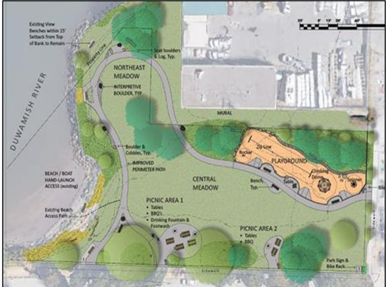
គំនូរបច្ចេកទេសបង្ហាញពីការធ្វើឱ្យប្រសើរឡើងនូវខ្លួននាពេលបច្ចុប្បន្ន

ខ្លួនមិត្តភាពផ្លូវទឹកឌុយវ៉ាមីស ( Friends of Duwamish Waterway Park ) បានដឹកនាំកិច្ចខិតខំប្រឹងប្រែងអស់ជាច្រើនឆ្នាំដើម្បីបកស្រាយចក្ខុវិស័យរបស់សហគមន៍សម្រាប់ខ្លួនសង្កាត់ជិតខាងជាមិត្តភាពទៅជាការចេញផែនការ។ ដោយធ្វើការជាមួយក្រសួង SPR និងខ្លួនរហូតដល់សិនទីក្រុងស៊ីតថល ( Seattle Parks Foundation ) , ខ្លួនមិត្តភាពផ្លូវទឹកឌុយវ៉ាមីស ( Friends of Duwamish Waterway Park ) បានរៀបចំសំណុំគម្រោងដែលអាចជាមូលដ្ឋានសម្រាប់ការធ្វើឱ្យប្រសើរឡើង។ ការសងសង់បានបញ្ចប់នៅចុងឆ្នាំ 2022។ ការដោះស្រាយកែតម្រូវទីតាំងបានចាប់ផ្តើមនៅឆ្នាំ 2020 ហើយបន្តនៅថ្ងៃនេះ។