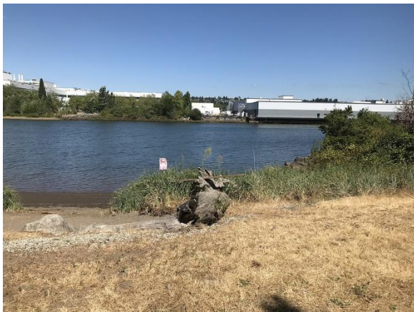
ទិដ្ឋភាពផ្លូវទឹកឌុយវ៉ាមីសផ្នែកខាងក្រោម ( Lower Duwamish Waterway ) ពីឧទ្យានផ្លូវទឹកឌុយវ៉ាមីស ( Duwamish Waterway ) នៅខែសីហា ឆ្នាំ 2022

ទីតាំងឧទ្យានផ្លូវទឹកឌុយវ៉ាមីស ( Duwamish Waterway Park ) ស្ថិតនៅជាប់នឹងទីតាំងមានសារធាតុបំពុលដែលទាមទារសម្អាតនៅផ្នែកខាងក្រោម ( Lower Duwamish Waterway 4 Superfund Site ) ដែលមានកំណត់ផ្លូវទឹកឌុយវ៉ាមីស ( Duwamish River ) ប្រវែង 5 ម៉ាយ។ ទីភ្នាក់ងារ ការពារបរិស្ថានសហរដ្ឋអាមេរិក ( he U.S. Environmental Protection Agency ( EPA ) ) បានបន្ថែម ទីតាំងមានសារធាតុបំពុលដែលទាមទារសម្អាតនៅទីតាំងមានសារធាតុបំពុលដែលទាមទារសម្អាតនៅផ្នែកខាងក្រោម ( LDW Superfund Site ) 5 ទៅក្នុងបញ្ជីអាទិភាពថ្នាក់ជាតិសារធាតុបំពុលដែលទាមទារសម្អាត ( Superfund National Priorities List ) នៅឆ្នាំ 2001 ។ ក្រសួងបរិស្ថានវិទ្យា ( Ecology ) កំពុងធ្វើការដើម្បីបញ្ឈប់ ឬកាត់បន្ថយប្រភពនៃការចម្លងធាតុបំពុល ទីតាំងមានសារធាតុបំពុលដែលទាមទារសម្អាតនៅផ្លូវទឹកឌុយវ៉ាមីសផ្នែកខាងក្រោម ( LDW Superfund Site ) ដែលជាភូមិភាគខ្សែបង្រួមដែលគណៈកម្មាធិការ “ការគ្រប់គ្រងប្រភព” 6 ដូច្នេះទីភ្នាក់ងារ EPA អាចបន្តដំណើរការសម្អាតកាកសំណល់នៅទីនោះ។