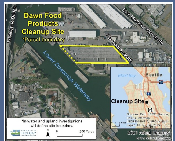
Mapa aéreo de Dawn Food Products sitio de la limpieza

Para solicitar una adaptación conforme a la Ley para Estadounidenses con Discapacidades, llame a Ecology al 425-533-5537, envíe un correo electrónico a LDW@ecy.wa.gov , o visite la página web ecology.wa.gov/Accessibility . Para el servicio de relevo o por TTY (teléfono de texto) llame al 711 o al 877-833-6341.