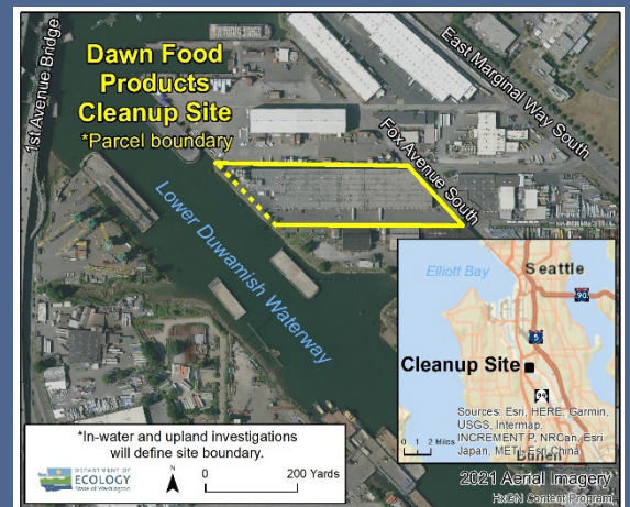
Dawn Food Products 鸟瞰图 清理点

ecology.wa.gov/Accessibility , 与生态部联系。如需中继服务或 TTY, 请拨打 711 或 877-833-6341。