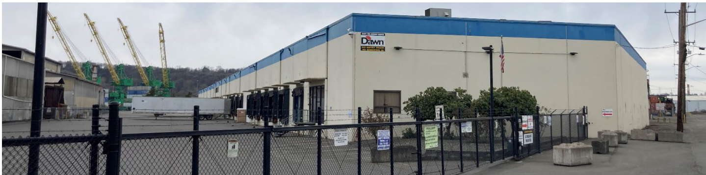
Dawn Food Products 主楼