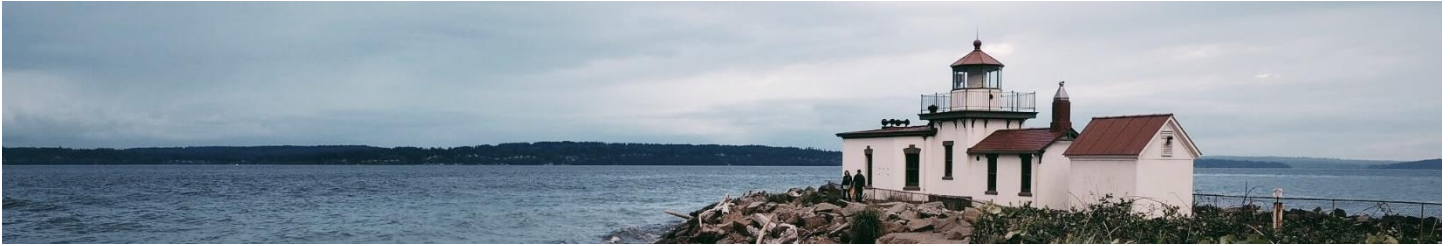
图 1 - 从南面看到的 West Point 灯塔，背景是 Bainbridge 岛。