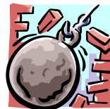
Мусор от сноса зданий

Указанные выше материалы при сжигании выделяют ядовитый дым. Вдыхание этого дыма опасно и может нанести вред вашему здоровью.