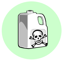
Упаковки от пестицидов