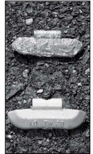
Un contrapeso de llantas hecho de plomo golpeado al lado de un contrapeso de llantas hecho de plomo nuevo

Cuando quita contrapesos de llantas hechos de plomo, es obligatorio reciclarlos apropiadamente. Visite la página Web de Ecología para la lista de ubicaciones.