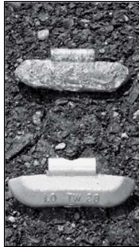
Un contrapeso de llantas hecho de plomo golpeado al lado de un contrapeso de llantas hecho de plomo nuevo

Cuando quita contrapesos de llantas hechos de plomo, es obligatorio reciclarlos apropiadamente. Visite la página Web de Ecología para la lista de ubicaciones.