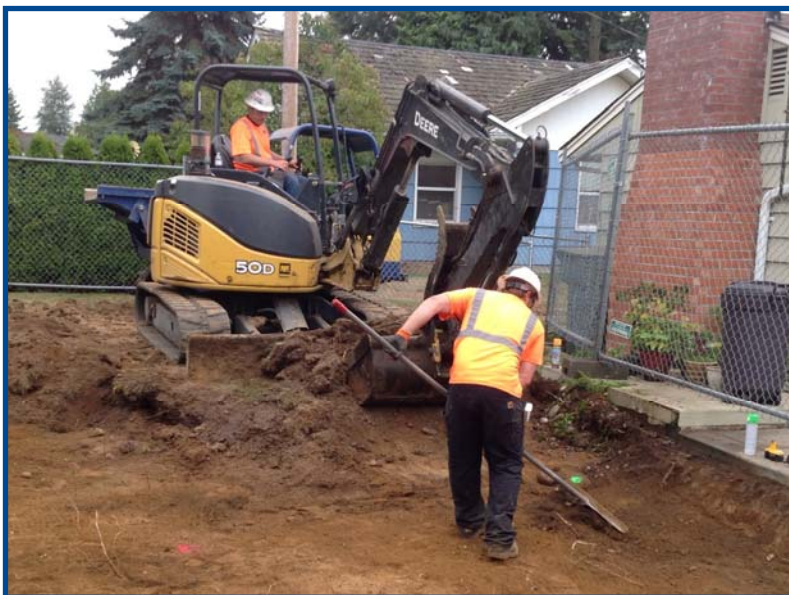
Работы по очистке почвы на территории парка American Legion Memorial запланированы на лето и осень 2015года. В сентябре парк будет закрыт на работы.