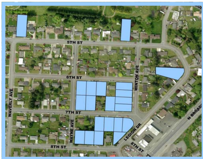
2014 группа по очищению почв жилых объектов