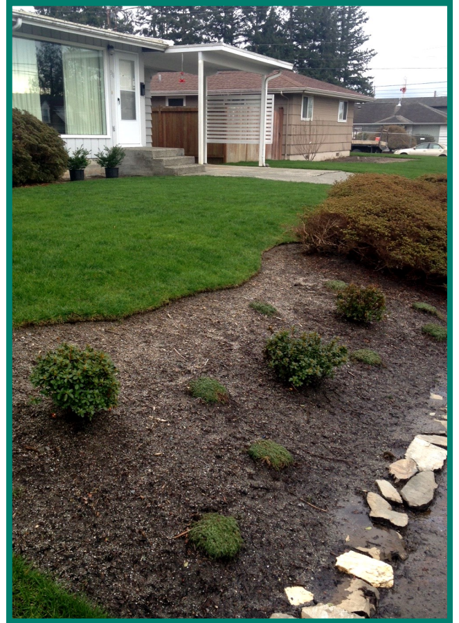
مجموعة تنظيف للعقارات السكنية المجددة حديثاً في 2015

نشكر لجميع من شارك في فترة التعليق العام للتقارير البيئية للمساحات المنخفضة في اكتوبر-نوفمبر 2015. نحن نستعرض ردود الفعل ووضعنا للمسات الاخيرة لهذه التقارير. الفرصة التالية للمشاركة ستكون فترة تعليق على مشروع خطة عمل التنظيف المقررة لهذا الصيف. ترقبوا!