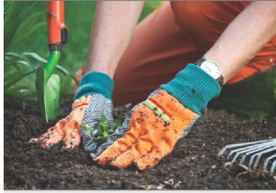
البس قفازات اثناء العمل في الحديقة

إذا كنت تسكن في منطقة التنظيف، ننصحك بأن تأخذ هذه الاحتياطات اللازمة لحماية اسرتك من التربة الملوثة: إذا كنت تسكن في منطقة التنظيف، ننصحك بأن تأخذ هذه الاحتياطات اللازمة لحماية اسرتك من التربة الملوثة.