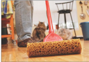
قم بمسح الغبار كثيراً