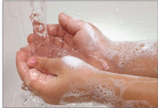
اغسل يديك بعد اللعب او العمل بالخارج