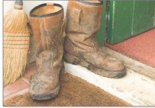
اترك احذيتك المتسخة عند الباب