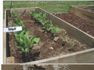
ازرع ورود ونباتات في اواني مرتفعة

إذا كنت بحاجة الى هذا المنشور بصيغة بديلة، اتصل بموظفة الاستقبال على الرقم 425-649-7000. الاشخاص الذين يعانون من فقدان السمع، اتصلوا على الرقم 711 لخدمة واشنطن ريلاي. الاشخاص ذوى الاعاقة فى الحديث يتصلوا على الرقم 877-833-6341.