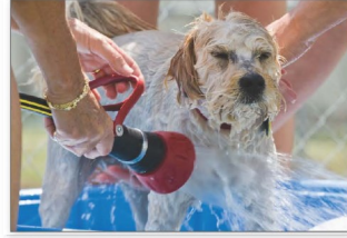
احفظ الحيوانات نظيفة